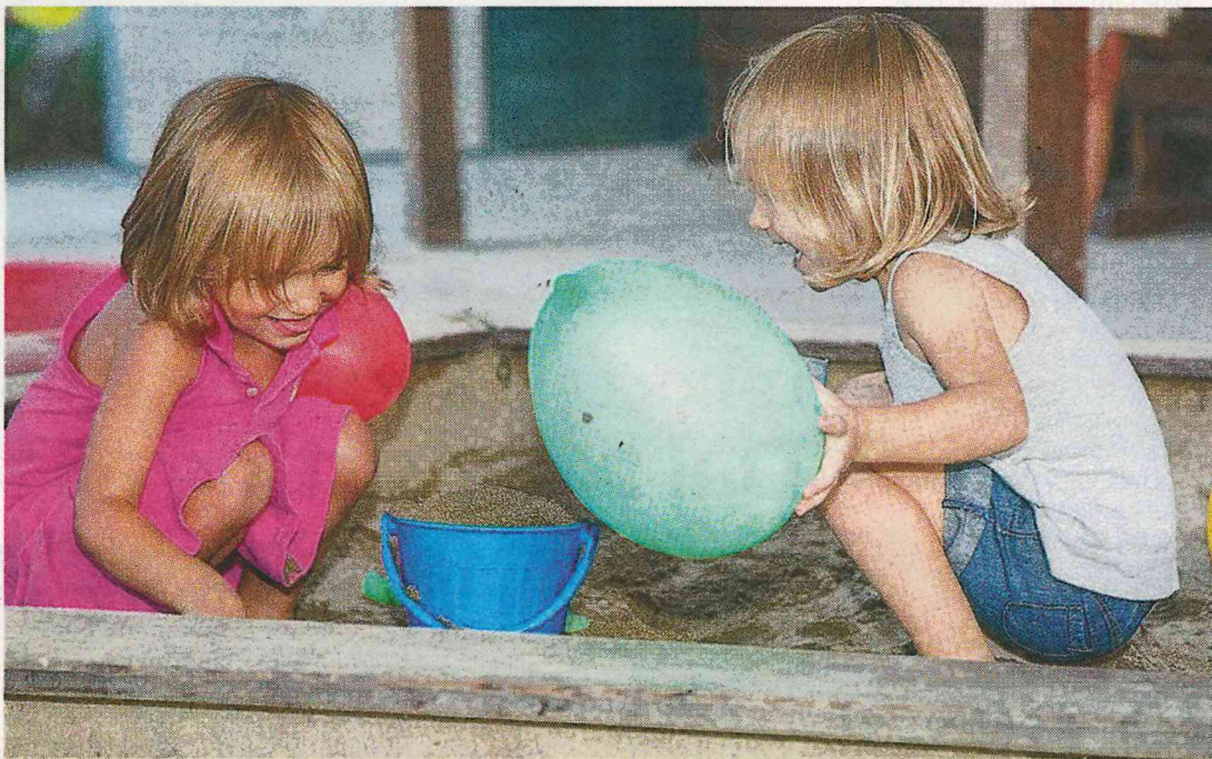
Un momento di gioco al nido «Abracadabra»: maneggiare la sabbia per sviluppare la manualità